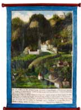
Pestfahne Seite mit Burg Falkenstein

Gerade durch die Coronapandemie wird die Zeit, als die Pest in unserer Gegend wütete, unter einem gewissermaßen „aktuellen Blickwinkel“ betrachtet. Die aufgrund der damaligen Pandemie und des Pestgelübdes im Jahr 1611 in Auftrag gegebene Pestfahne, lässt den Blick in zwei Ortsteile von Flintsbach zu. Unmittelbare Aktualität bekommt die Betrachtung der Fahne durch die Weihe des Gedenkkreuzes in Erinnerung an das Kirchlein „Heilig Kreuz“.