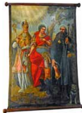
Pestfahne Seite mit Heiligen St. Benno, Bischof v. Meissen mit Schlüssel und Fisch, St. Sebastian, röm. Soldat mit Pfeilen, St. Rochus, Jakobspilger, mit Pestwunde, Stab und Hund mit Brot

dan halben Tag zu fasten und feyern verlobt worauf, Gott sey dank, die laidige pest also gleich nach gelassen und kein-Mensch mehr daran verstorben ...“