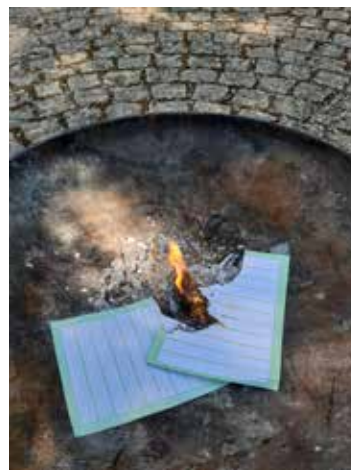
Verbrennung negativer Erlebnisse

des Lernens zuhause und heftete es an den Baum. So fand es eine Schülerin ganz wunderbar, dass sie zwischen dem Lernen immer wieder ihren Hasen versorgen und streicheln konnte. Ein anderes Kind beichtete, dass ihm der Papa oft die Rechnungen vorgesagt hatte. Vielen Familien bereitete das gemeinsame Basteln eines Gebäckes aus Knete (ein Auftrag für den HSU-Unterricht) viel Freude. Als besonders positiv erachteten die Kinder, die viele Zeit, die sie mit ihren Familien verbringen konnten. Man kann bereits erkennen, dass die Kinder in einer angenehmen Atmosphäre zuhause gelernt und gute Erfahrungen gesammelt haben.