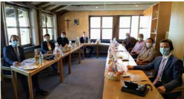
Vorstand und Aufsichtsrat der Raiffeisenbank Oberaudorf eG

Auch in Pandemie-Zeiten zeigt sich die Innovationskraft der Raiffeisenbank Oberaudorf eG. So wurde nach reiflicher Planung und je einem Testlauf im Vorfeld für die Geschäftsstellen Flintsbach, Kiefersfelden und Oberaudorf die Vertreterversammlung des abgelaufenen Geschäftsjahres 2019 online abgehalten. Die Mitgliedervertreter erhielten vorab Zugangsdaten per Email und konnten sich damit abgesichert in eine Online-Konferenz einloggen. Dort verfolgten die Teilnehmer dann anhand einer Präsentation, begleitet von den Erläuterungen des Aufsichtsrates und des Vorstandes, die virtuelle Vertreterversammlung. Der gesamte Aufsichtsrat, die Bankvorstände, Mitarbeiter und einige Mitglieder trafen sich dazu in der Bank, verteilt im Gebäude der Hauptstelle Oberaudorf, um gemeinsam mit ausreichend Abstand und vorschriftsmäßigem Mundschutz alles über die 2019er Erfolge der Bank zu erfahren.